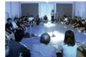
帰宅困難状態で見知らぬ人と宿泊訓練