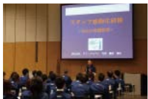
モチベーション向上・組織力向上など