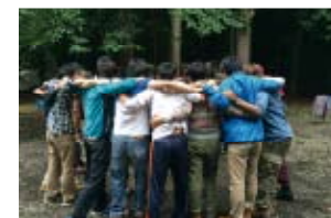
大自然の生活や富士登山で心身を鍛錬