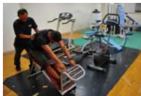
ストレッチベンチで腰痛対策や疲労回復