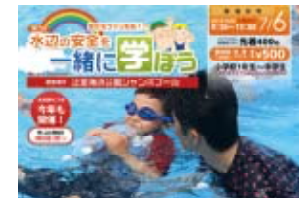
水難・津波・救急等のリスク対策訓練