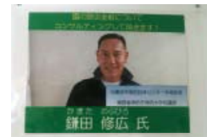
園を中核とした地域防災力強化訓練