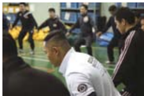
共に支え汗を流すチームビルディング