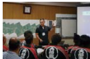
災害に強い人やまちづくりの実践提案