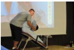
身体機能低下による労働災害を防止