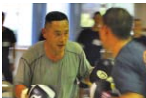
戦闘服で災害と冷静に闘う方法を学ぶ