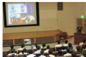
初！教職員と学生が共に学ぶ教育